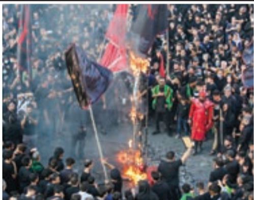
این سبب، بیست و سه روز است