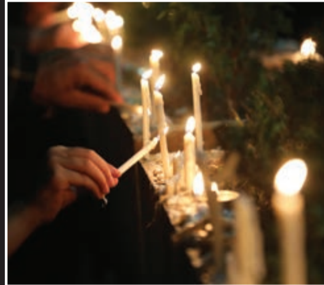
این شام عزاداران امام حسین (ع)