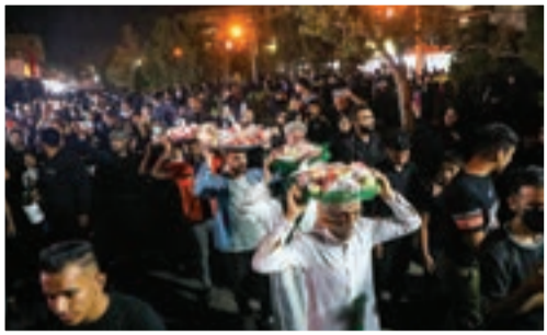
آیین سینه گردانی حضرت قاسم (ع) در شهرک شهید بهشتی