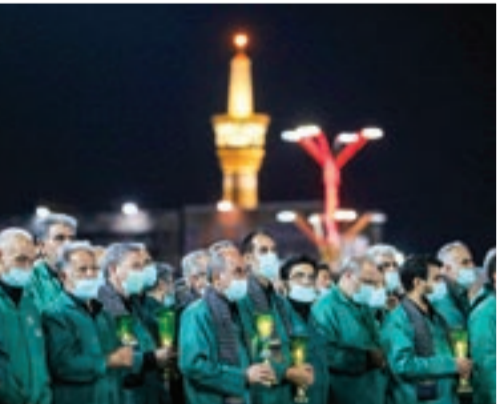
این سیزده ساله خطبه خوانی شب عاشورا در حرم مطهر رضوی