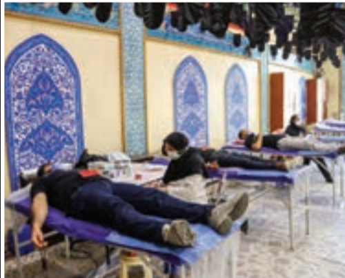
پوشش نذر خون حسینی