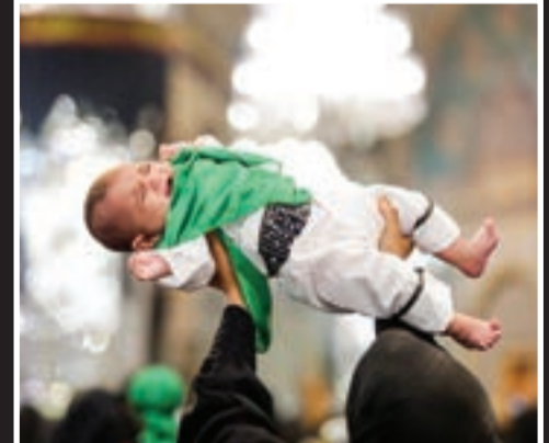
محل شیرخوارگان حسینی در حرم مطهر رضوی