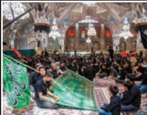
ویژه برنامه «احلی من العسل» با حضور دانش‌آموزان مشهدی