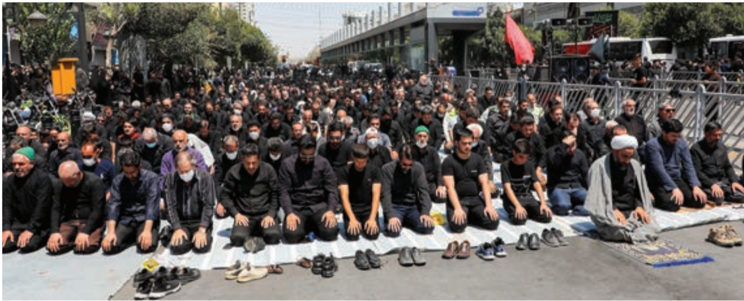
نماز باشکوه ظهر عاشورا در محورها چهارگانه منتهی به حرم امام هاشم (ع) اقامه شد