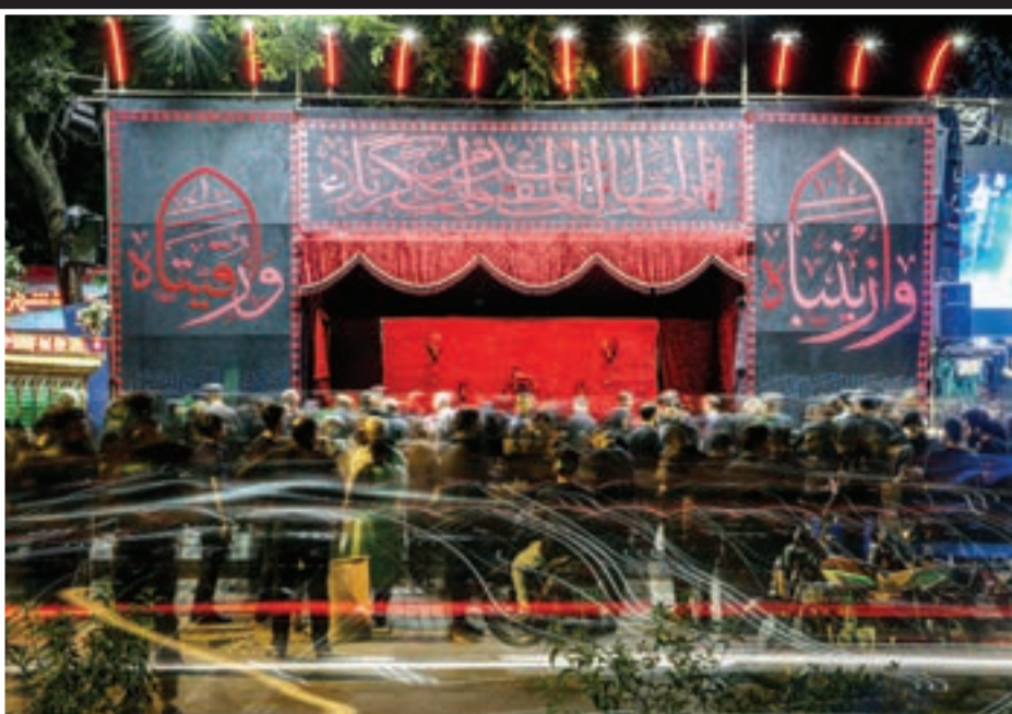
این روزها گوشه‌گوشه شهر به موبک‌هایی مزین شده که هرکدام نشان مخفی برای عرض ارادت سوگواران امام شهید است