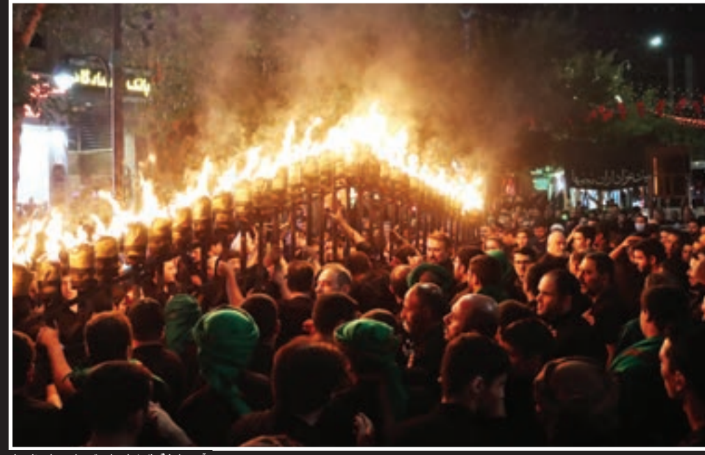
آیین معمل گردانی نجفی‌های مفیم مشهد در شب ناسوعا