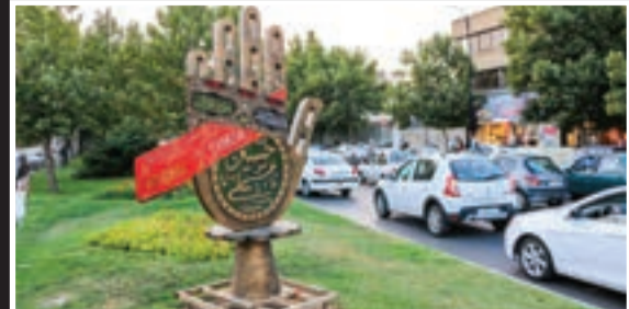
فلسازی شهری ویژه ناسوعا و عاشورا حسینی در خیابان‌ها و معابر مختلف مشهد (ع)