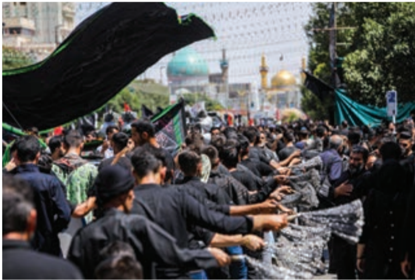
همه خیابان‌های منتهی به حرم مطهر امام رضا (ع) در روزهای ناسوعا و عاشورا آمیزان عزاداران بی‌شمار حسینی بود