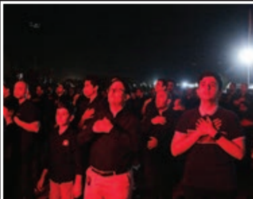
سوگواره «مورشد نینوا» در بوستان جهان شهر